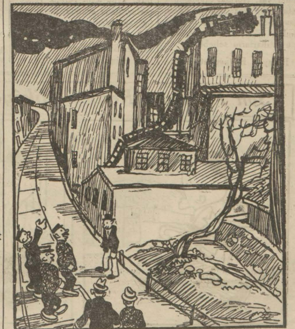
Memur — Koşun, arkadaşlar... Firari tren karşılıklı evin bacasına tırmanıyor, kaçıp gidecek.

"Bir İhtiyar Tren Altında Kaldı, Fakat Ezen Treni Bulmak Mümkün Değil. Gazeteler"