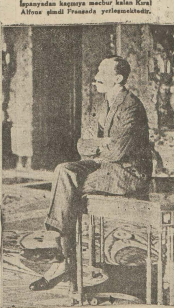
İspanyadan kaçmış mecbur kalan Kral Alfonso şimdi Fransada yerleşmektedir.