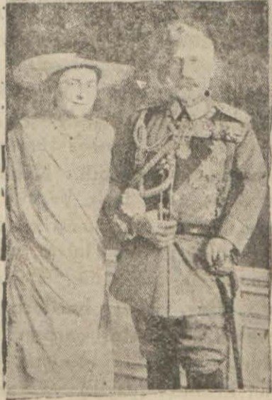
Sabık Alman İmparatoru ve yeni karısı