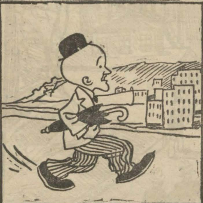
1: Hasan B. — Hazır Ankaraya gelmişken şu bizim Übeydullah Efendiyi bir göreyim.