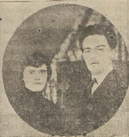
Sabık İmparatoriçe Zita ve Macar krallığını İstiyen Arşidak Otto