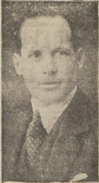
Sabık Yunan Kralı Kos- tantin şimdi İngilterede yaşamaktadır.