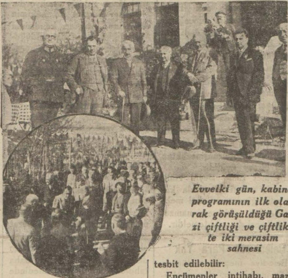
Evvelki gün, kabine programının ilk olarak görüldüğü Gazi çiftliği ve çiftlikte iki merasim sahnesi

Tahkikat neticesinde genç kızın ticar Müniş Beyin yanında evlâtlık olduğu anlaşılmıştır. Hâdisenin bir intihar veya katil vakası mı olduğu anlaşılmadığından kalbi ile diğerleri tıbbi adli müessesesine gönderilmiştir.