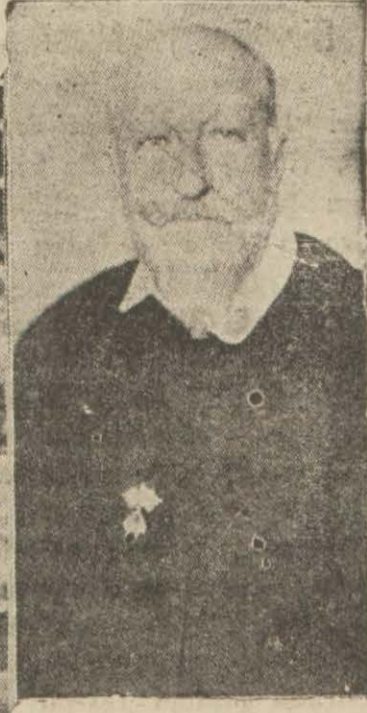
Sabık Bulgar Kralı Fer- dinant şimdi Almanyada yaşamaktadır.